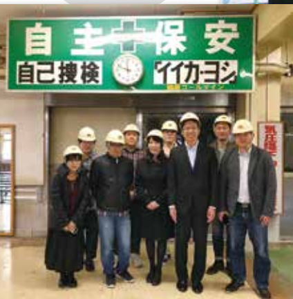
釧路市を訪問(炭鉱見学)