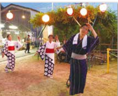
地元で盆踊りに参加