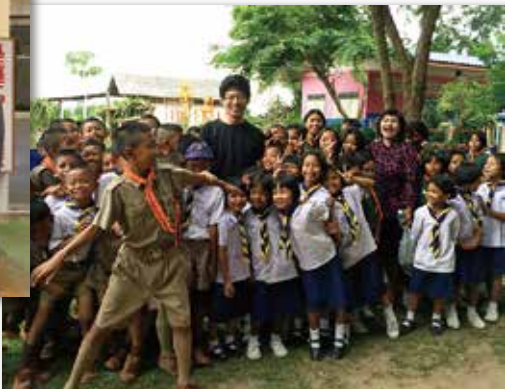
タイの貧村を訪問し 元気な子どもたちと