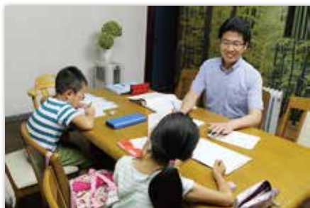
五条川ゼミ(塾)での授業